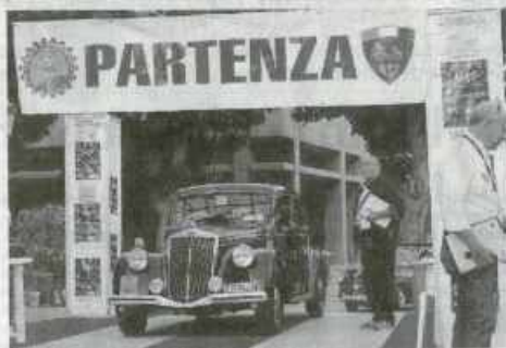
Una delle auto in gara nella scorsa edizione