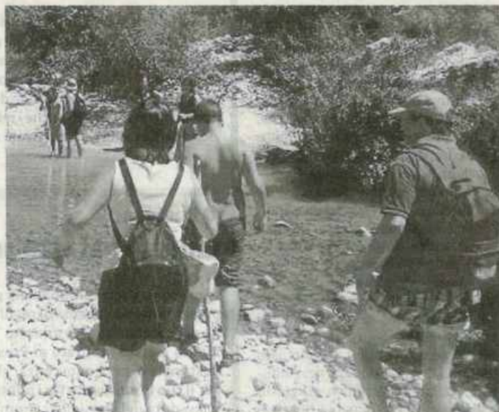
Trekking fra i boschi

●●● Domani mattina, ad Erice, saranno inaugurati i primi due sentieri sistemati di recente nell'ambito del progetto "Trekking Tourism". I percorsi sono stati contrassegnati, mappati e accatastati con la segnaletica dal Cai grazie al volontariato dei soci del Club Alpino Italiano con il supporto operativo dell'Azienda Foreste Demaniali di Trapani e l'ausilio finanziario del Comune di Erice, quale azione di pre-avvio, nell'ambito del più complessivo progetto "Rete sentieristica dell'Agroericino". Per l'occasione sono state organizzate delle escursioni lungo il sentiero di Sant'Anna, che riprende la storica strada per Erice, snodandosi su di un percorso di cinque chilometri, ed in quello di "Porta Castellammare-Tre Chiese", che si affaccia invece nel versante del golfo di Bonagia in un circuito ad anello attorno la montagna passando dalle chiese rupestri di